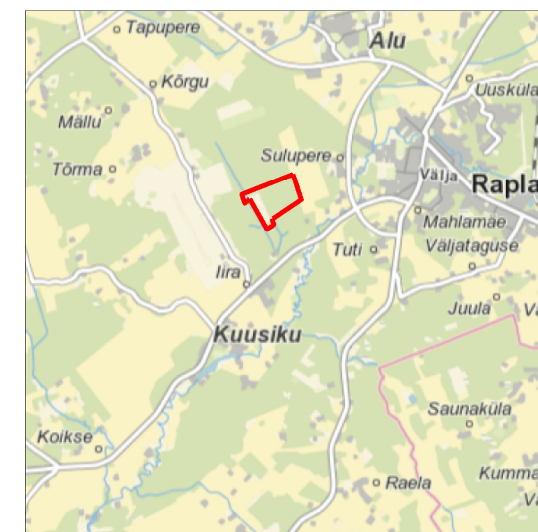
Kaardileht nr 631 Rapla